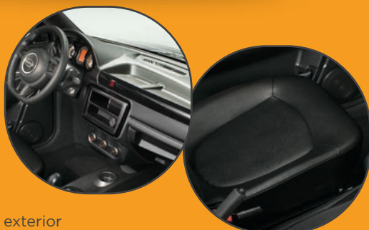
TAPICERÍA ECO-PIEL NEGRA

Pack Chrome externo y color metalizado bicolor en toda la gama Due Young.