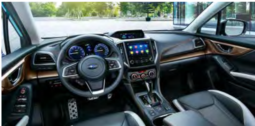
Cuero gris claro*