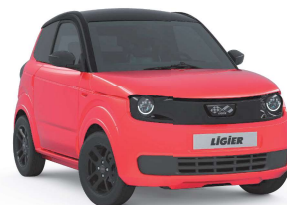
Rojo Toledo Metalizado